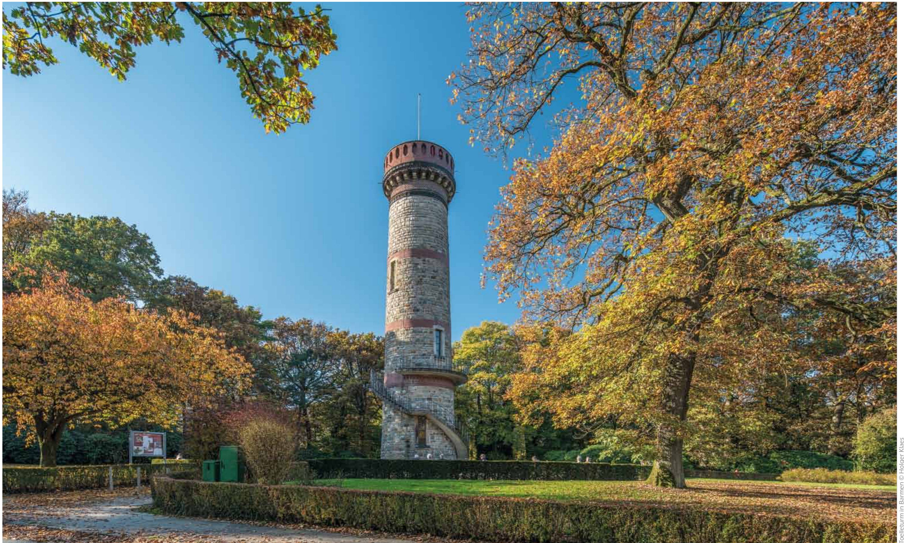
Toelleturm in Barmen