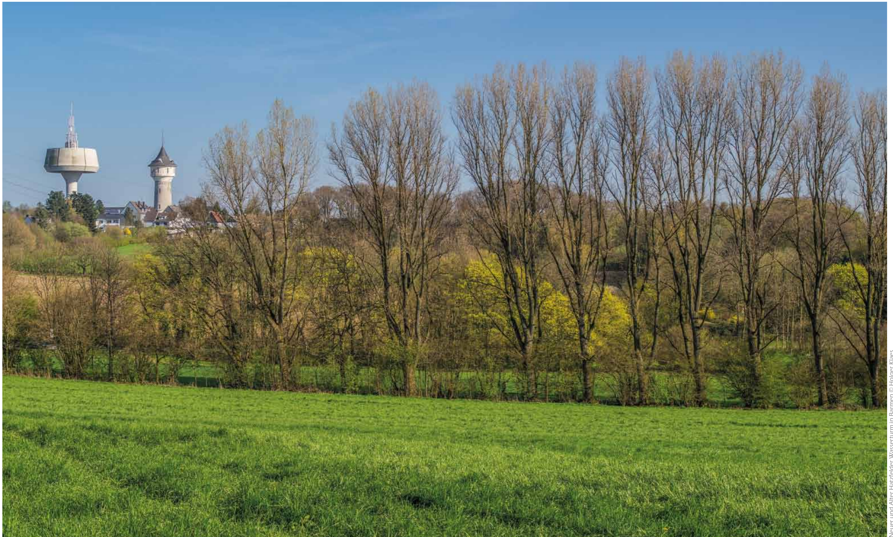
Neuer und Alter Hatzfelder Wasserturm in Barmen