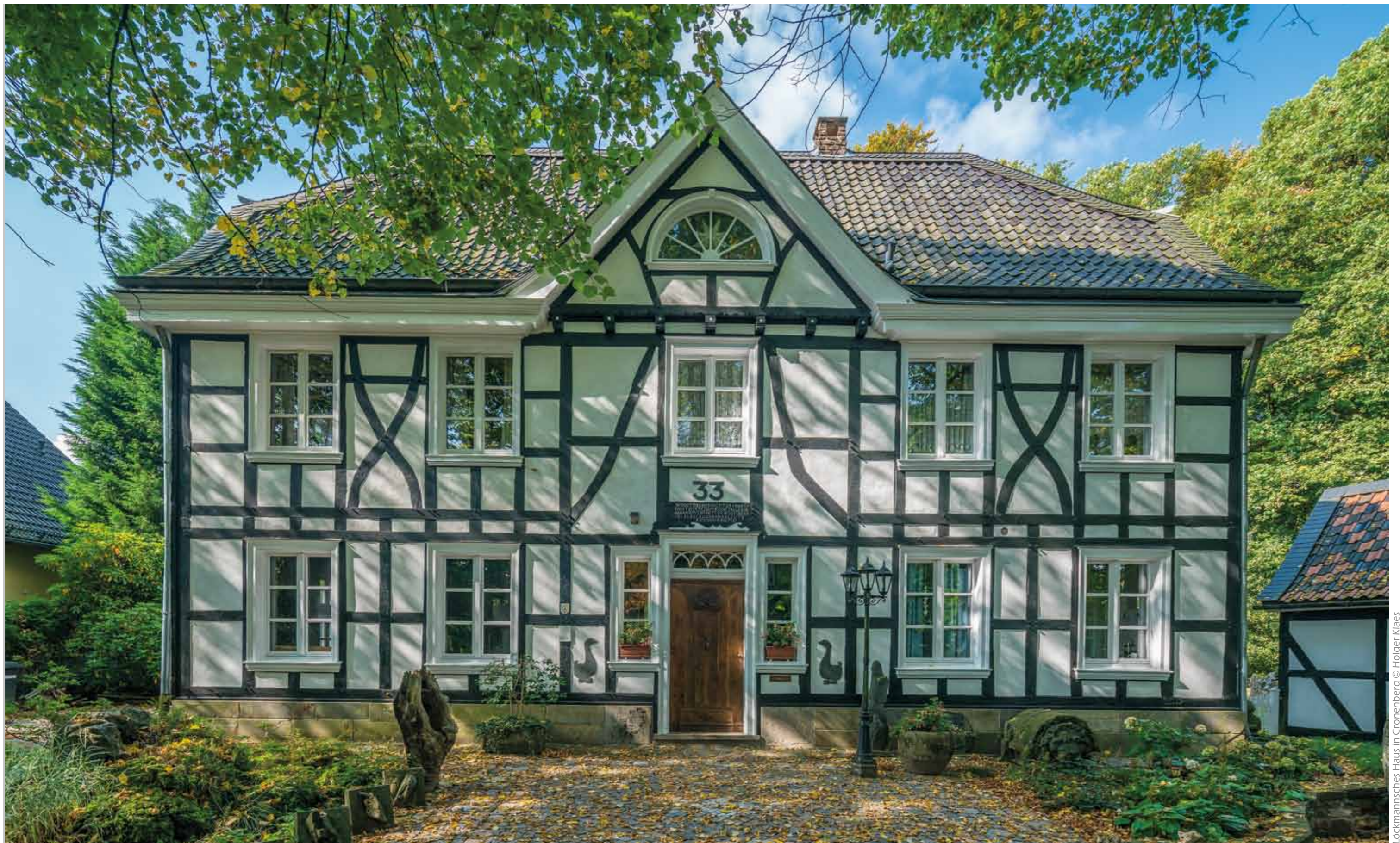
Lockmannsches Haus in Cronenberg