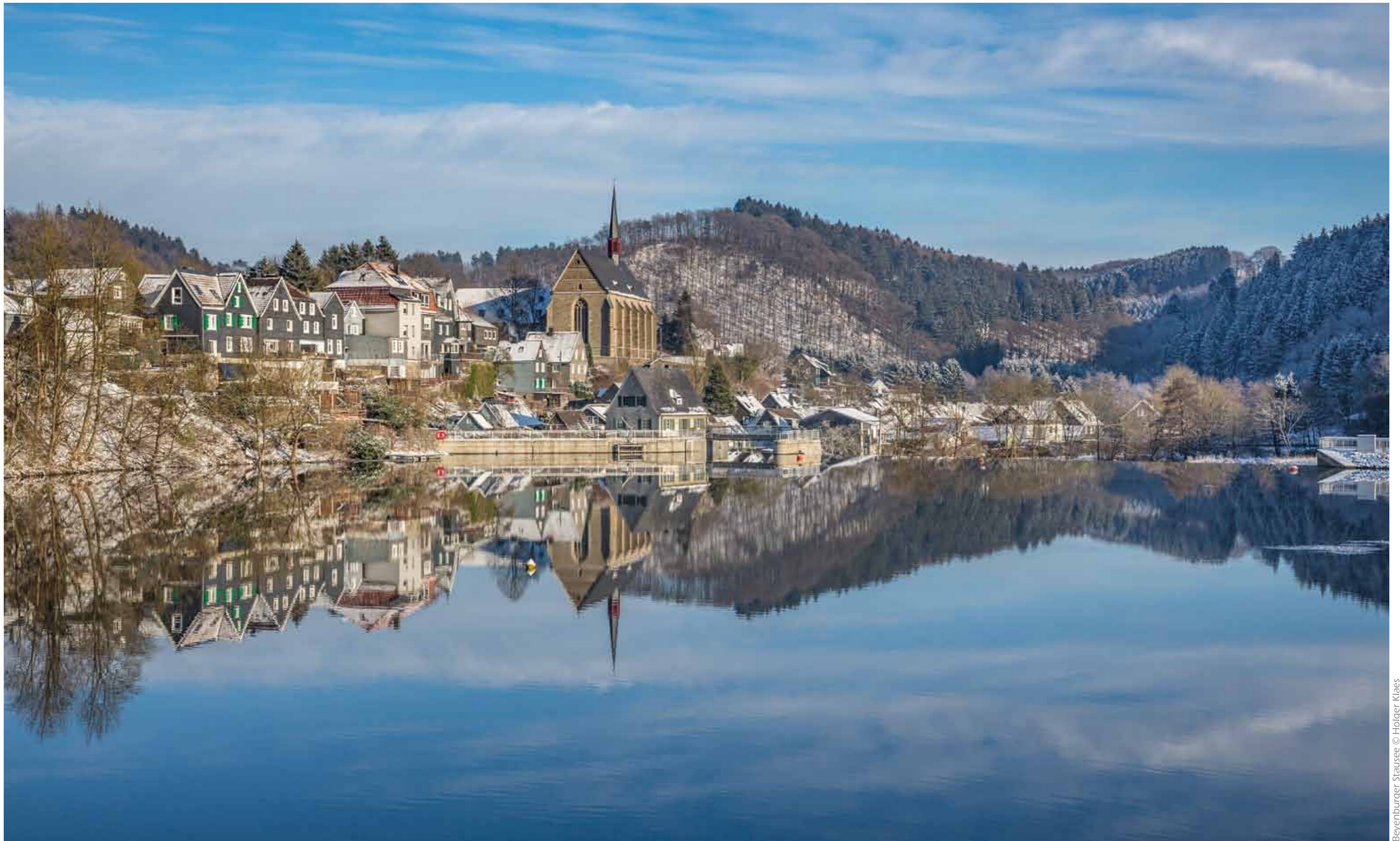
Beyenburger Stausee