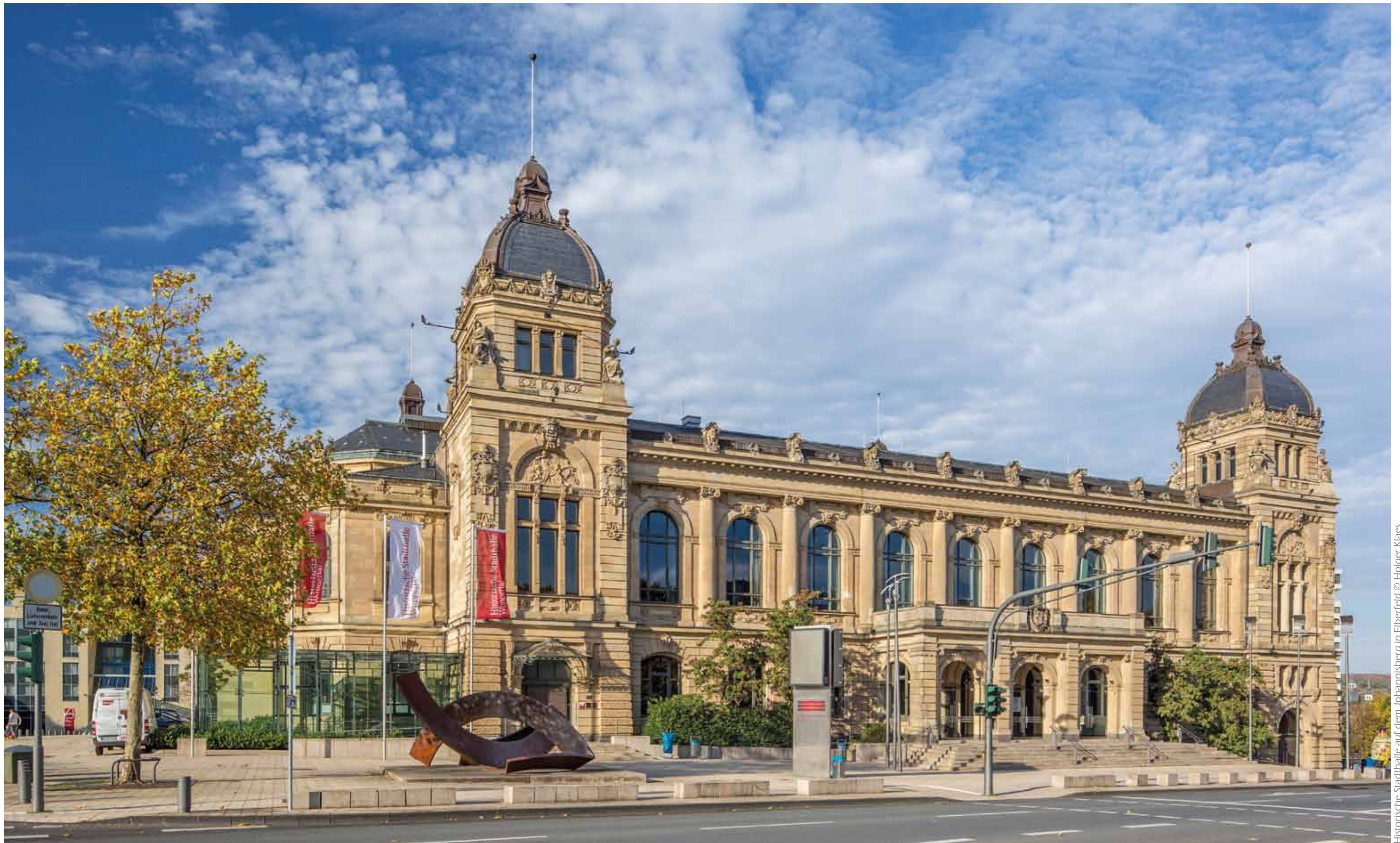
Historische Stadthalle auf dem Johannisberg in Eiberfeld