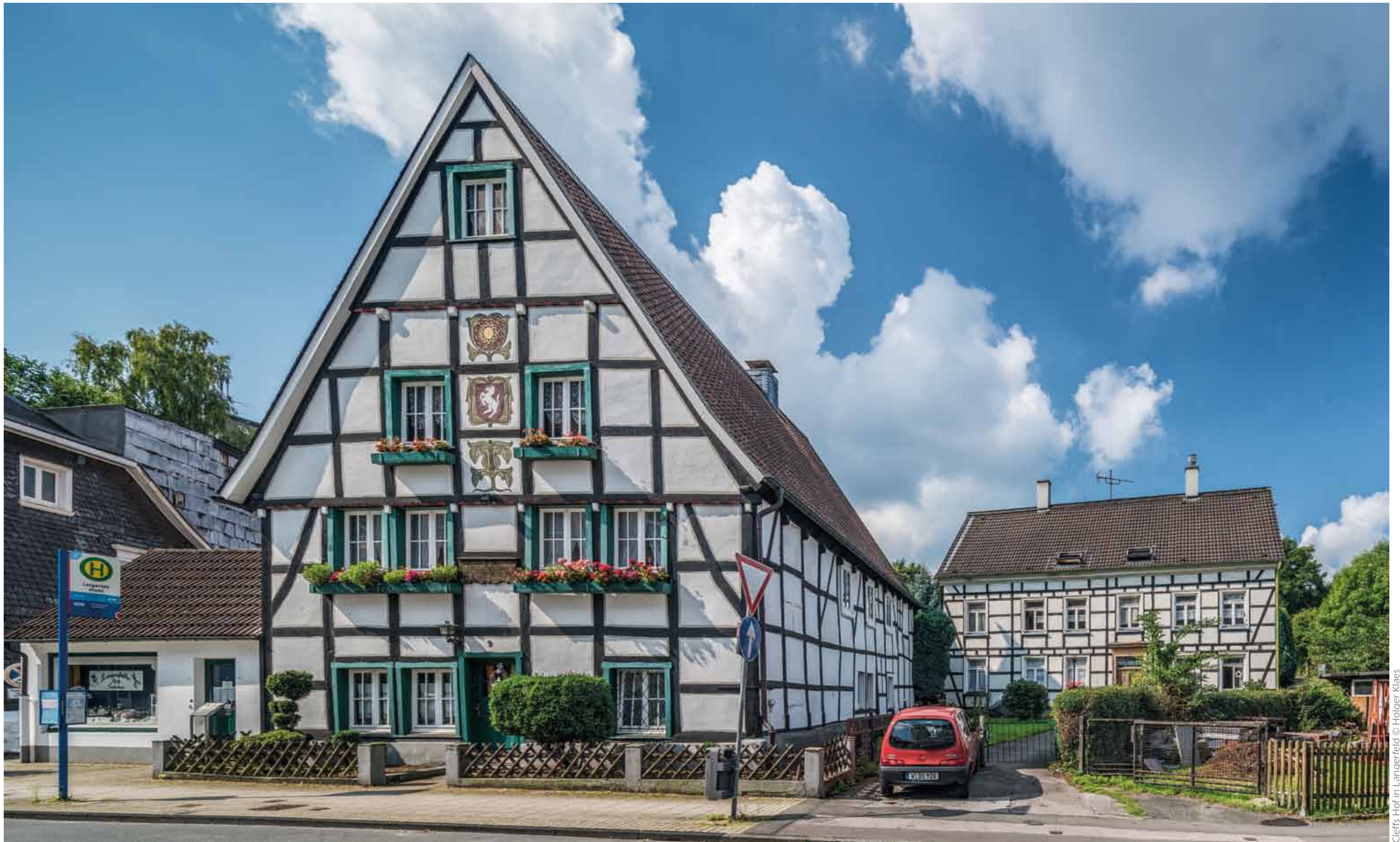
Cleffs Hof in Langerfeld