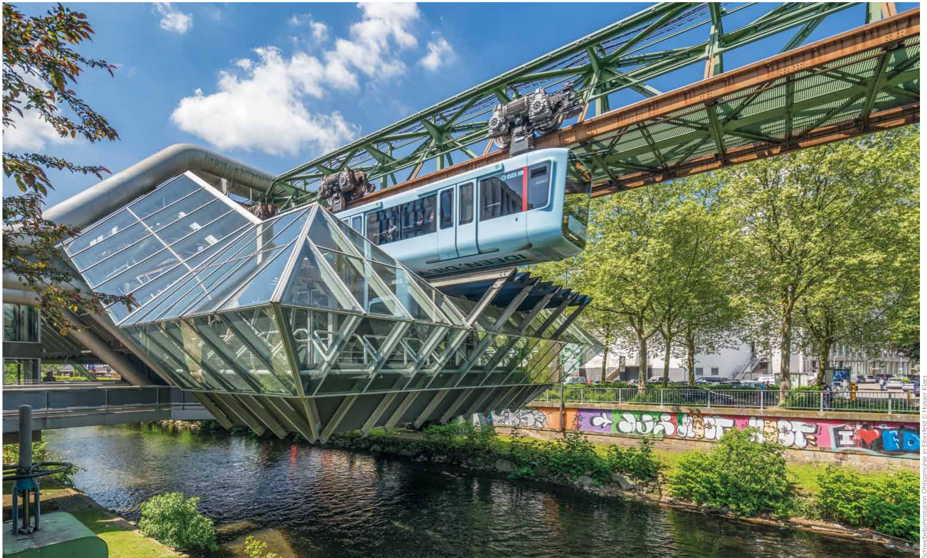
Schwebebahnstation Ohligsmühle in Eberfeld