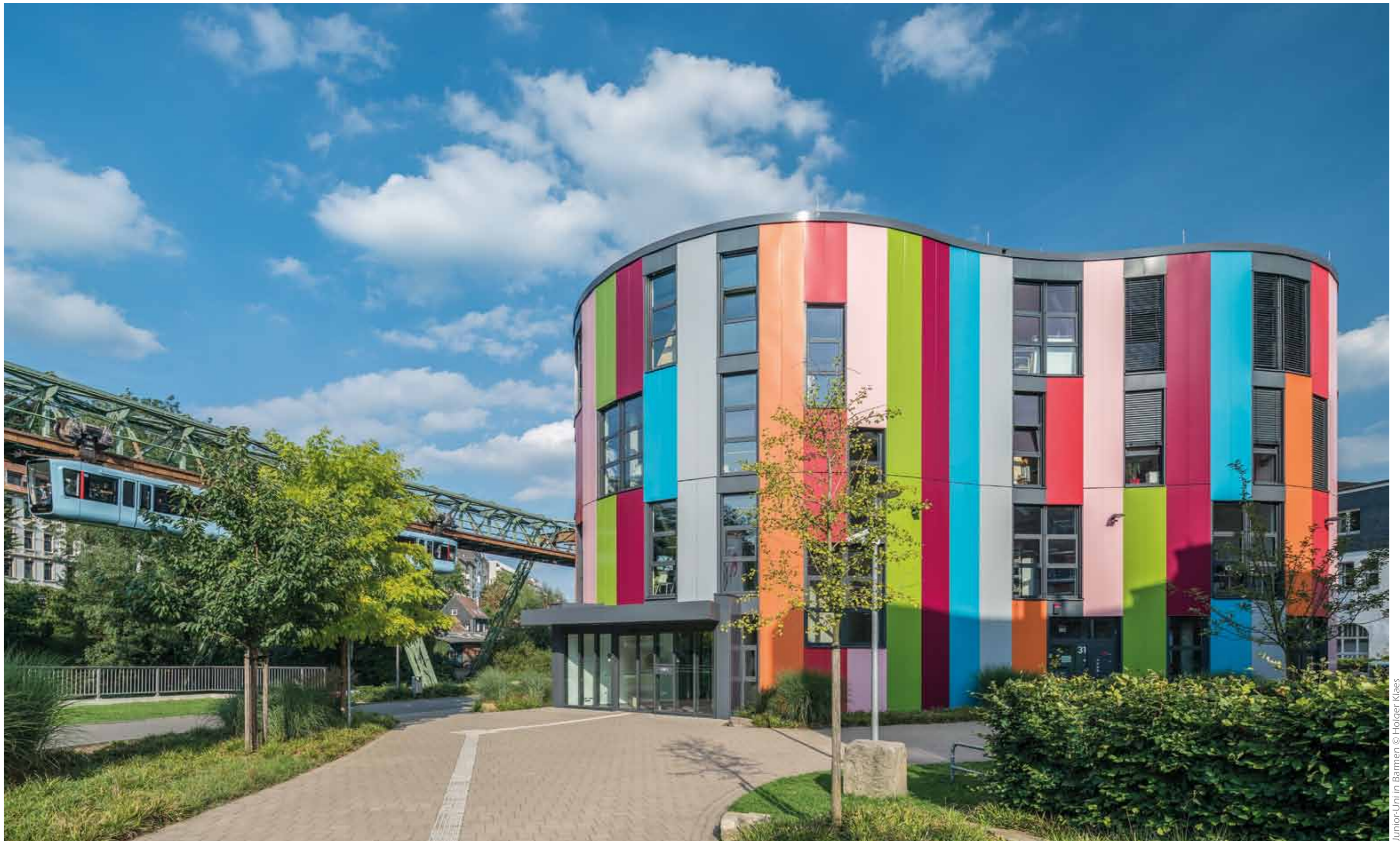
Junior-Uni in Barmen © Holger Kläus