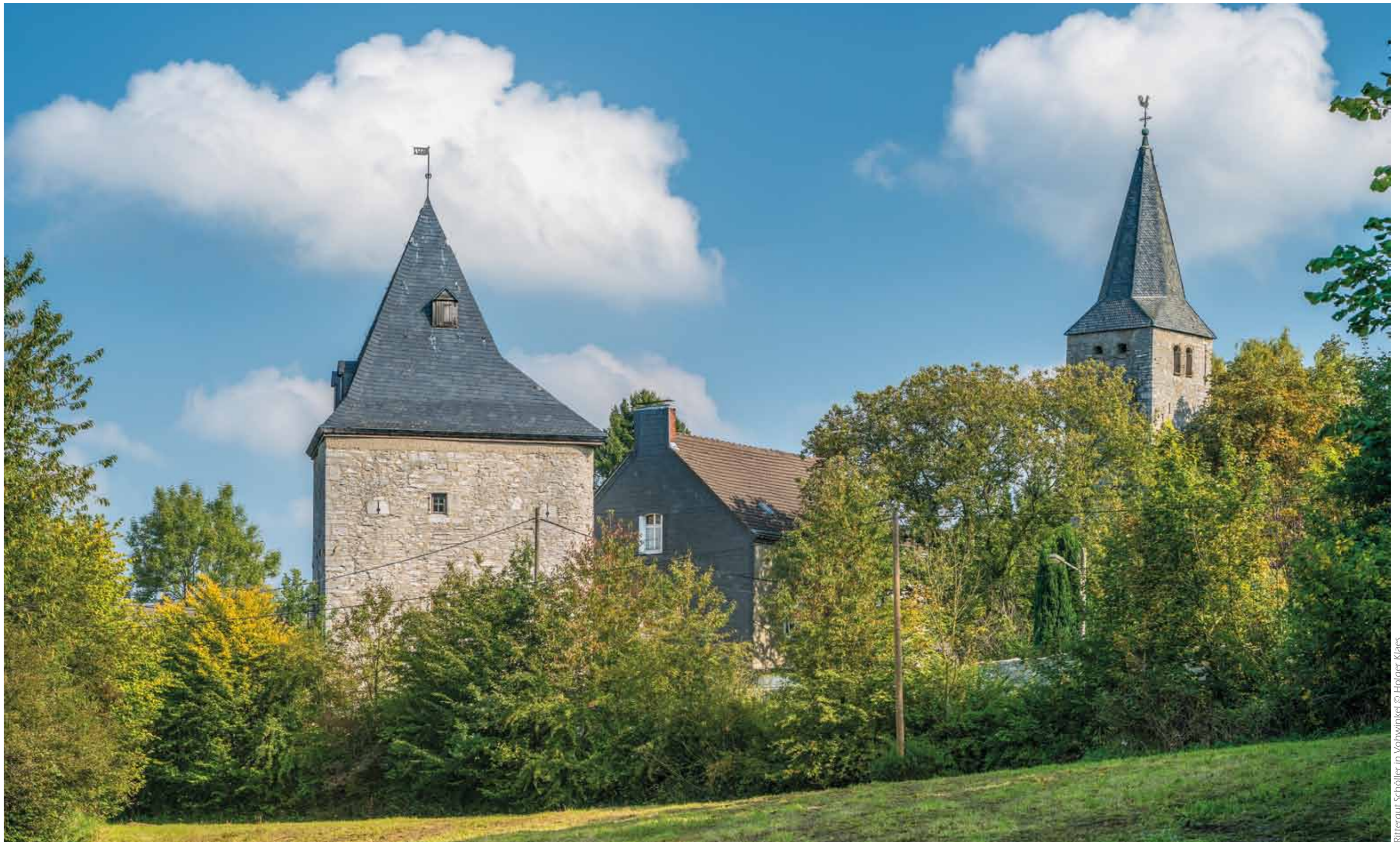
Rittergut Schöller in Vohwinkel