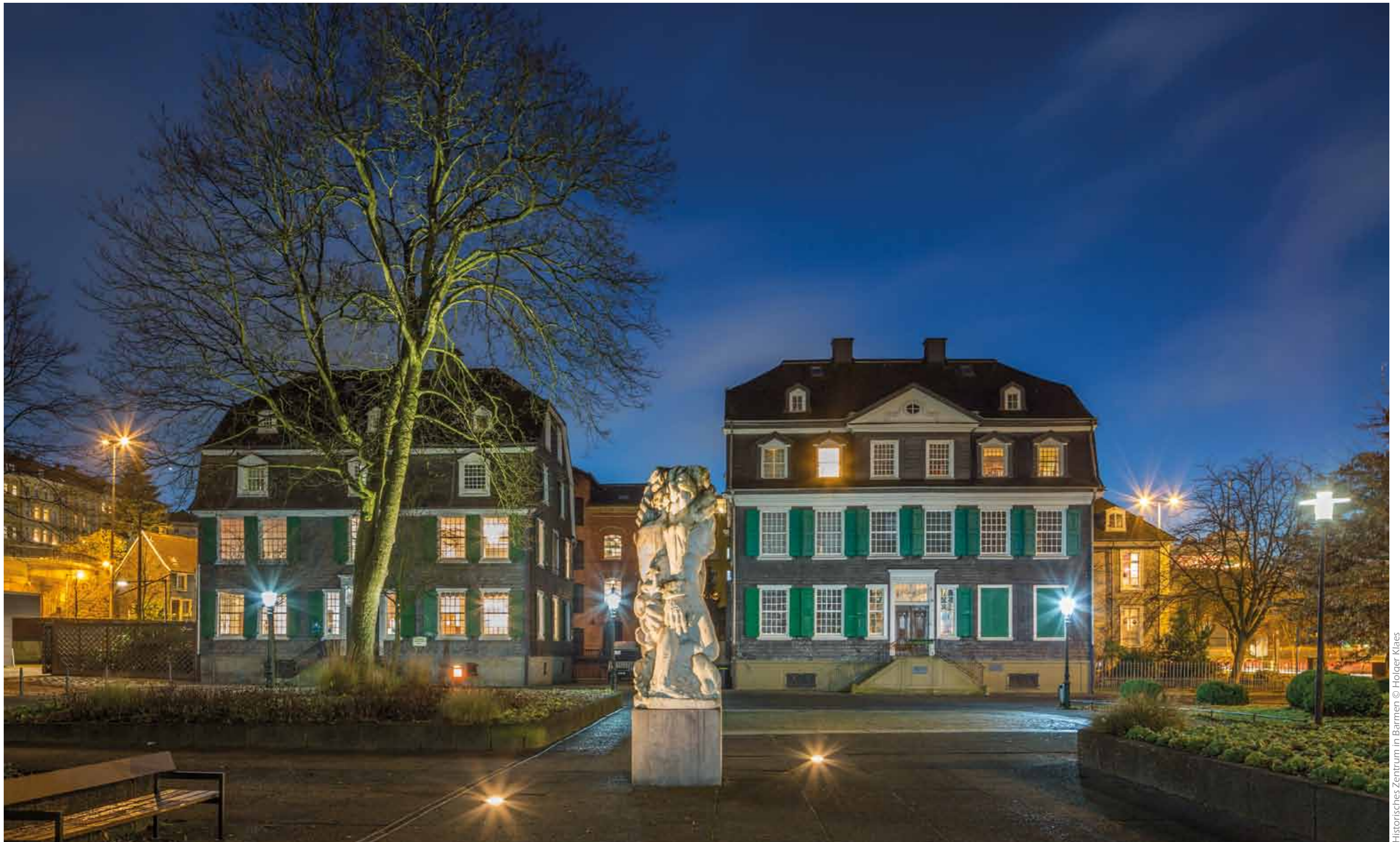
Historisches Zentrum in Barmen