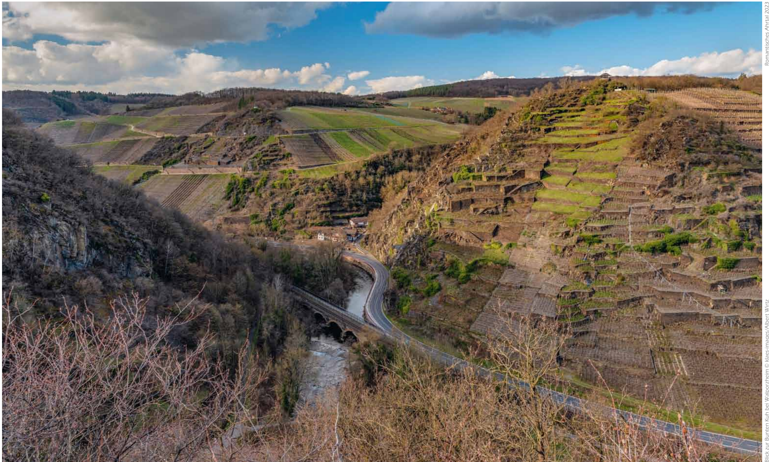
Romantisches Ahrtal 2023