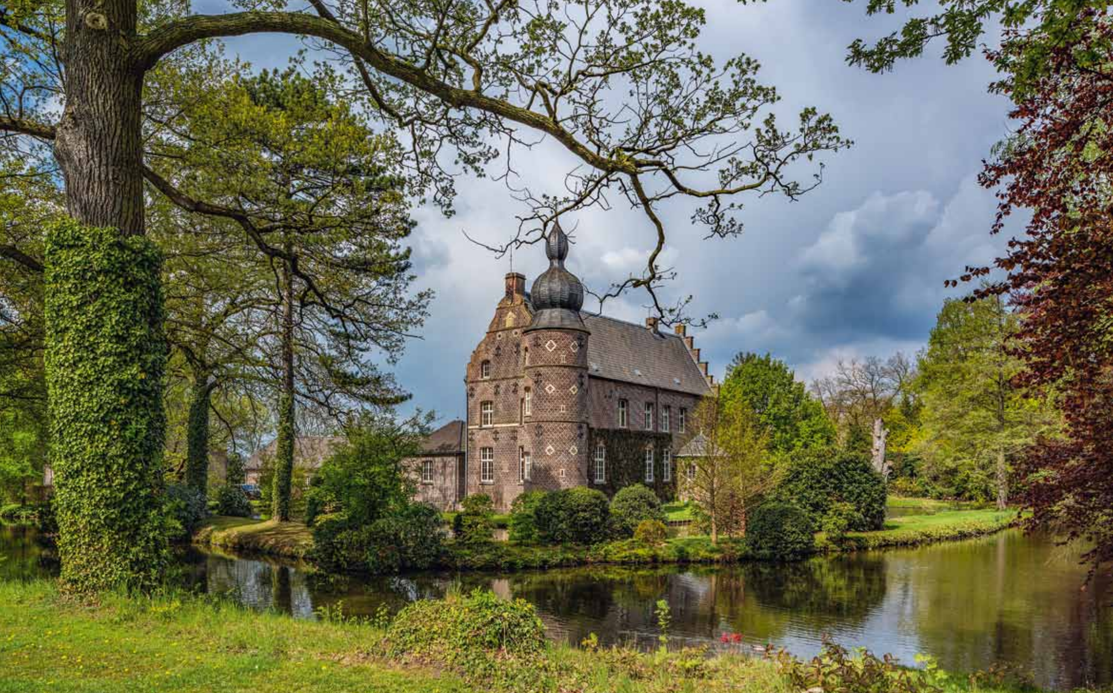
Haus Coull in Straelen