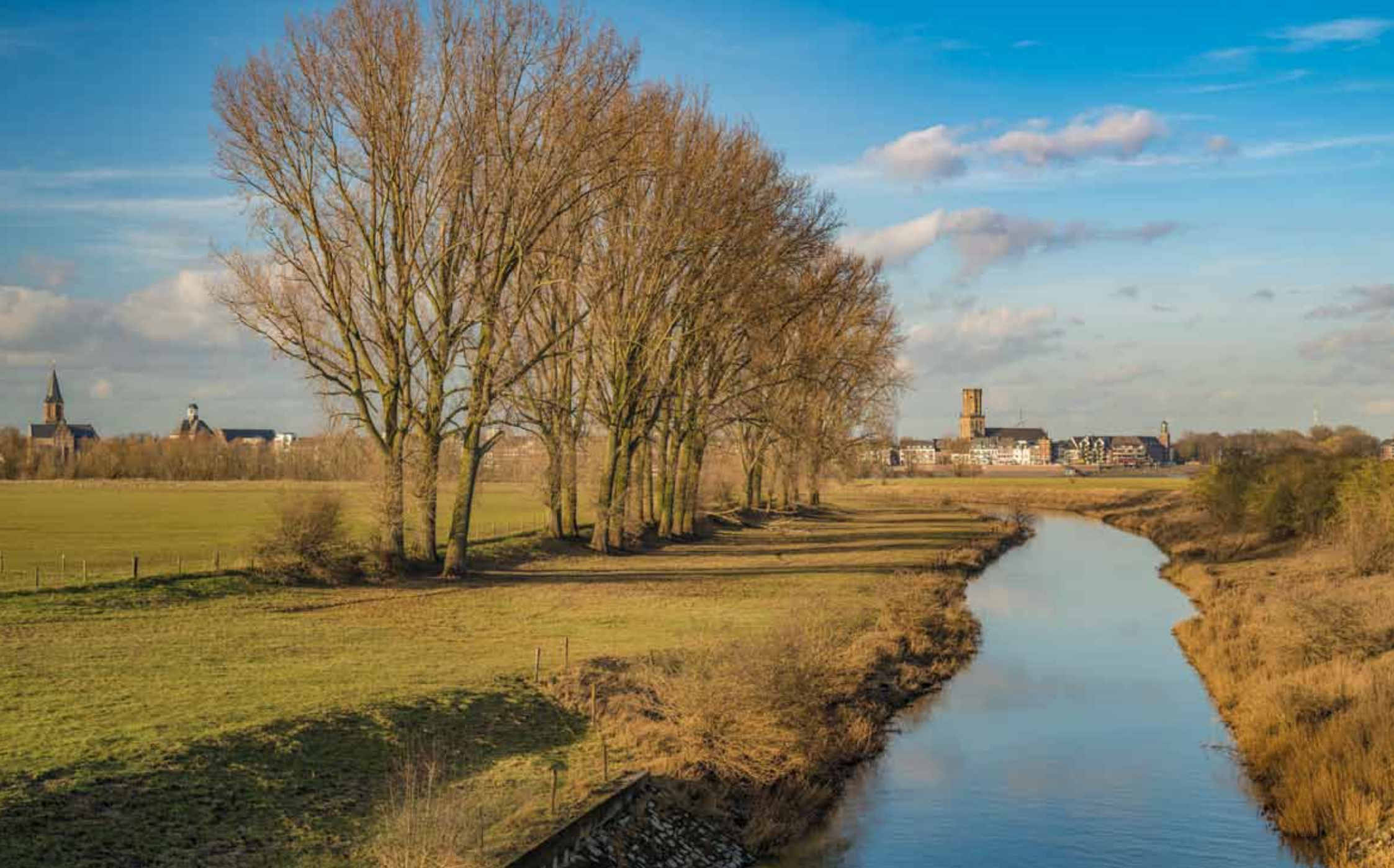
Deichvorland bei Kalkar-Grieth mit der Kalfak und Blick auf Emmerich am Rhein