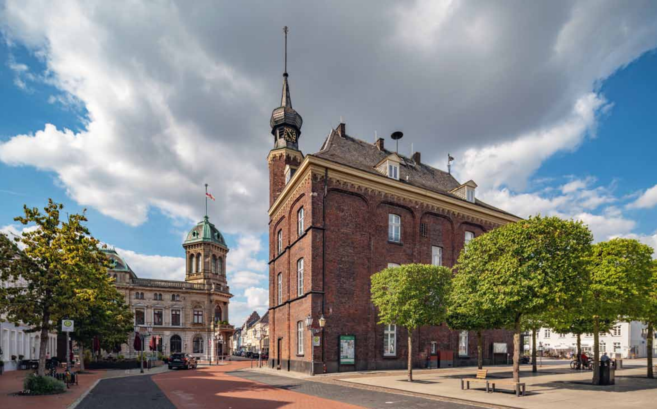
Altes Rathaus am Marktplatz mit Uderberg-Palais in Rheinberg