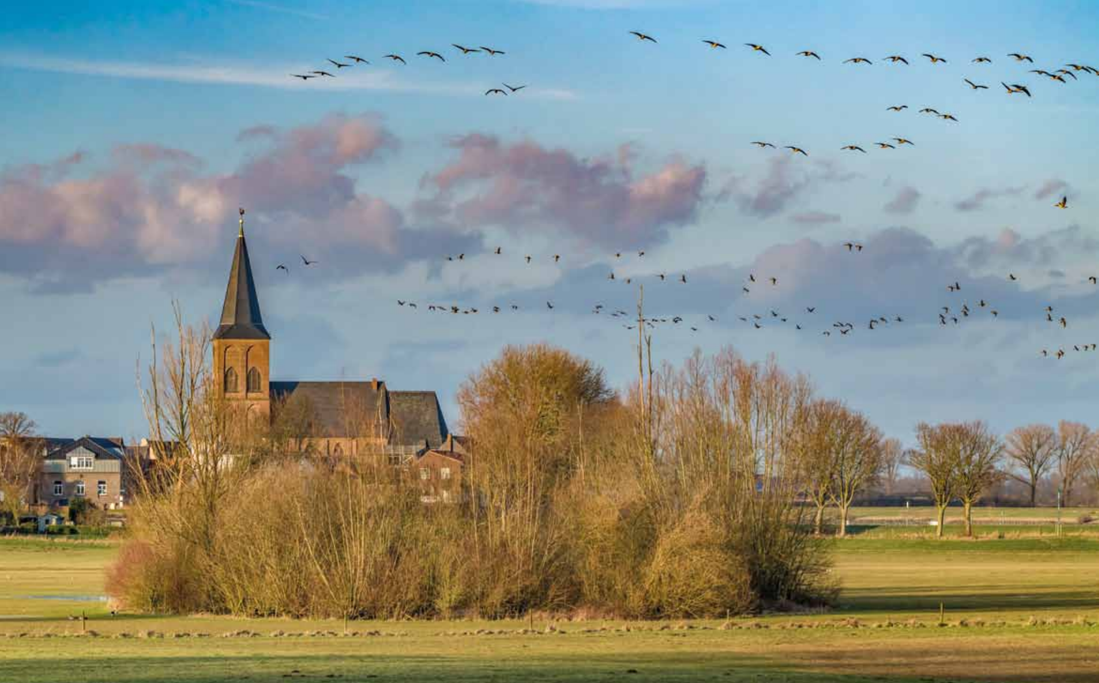
Wildgänse in Grieth am Rhein mit St. Peter und Paul bei Kalkar