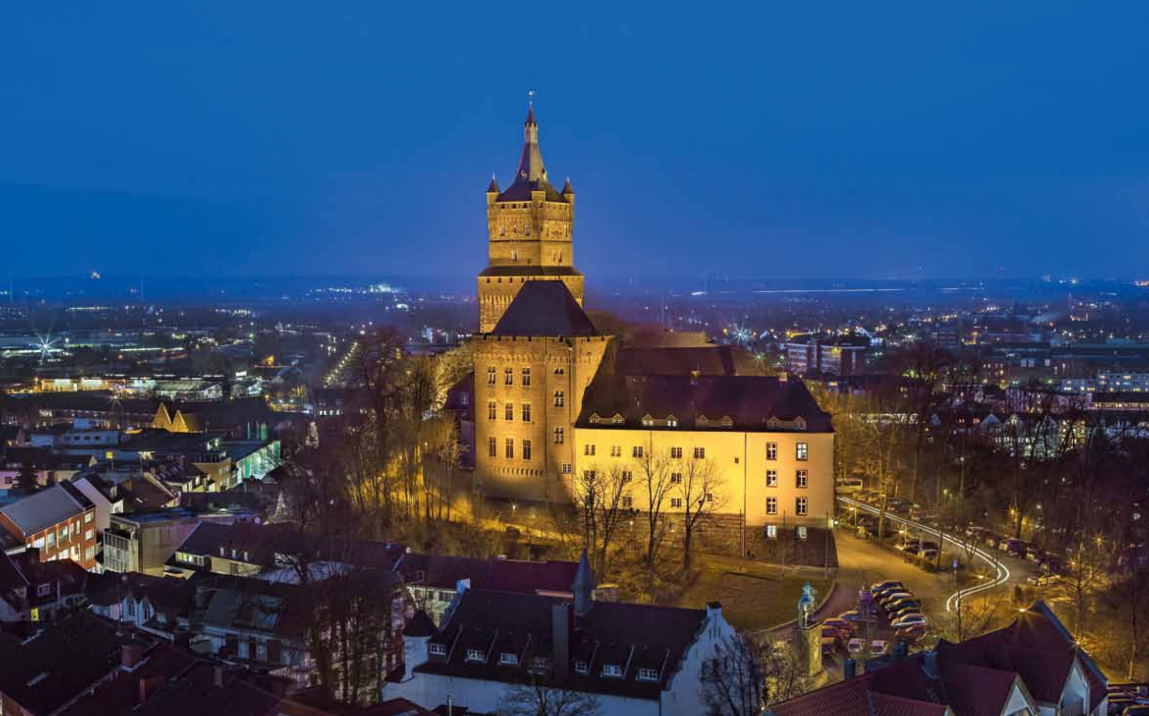
Blick zur Schwanenburg in Kleve