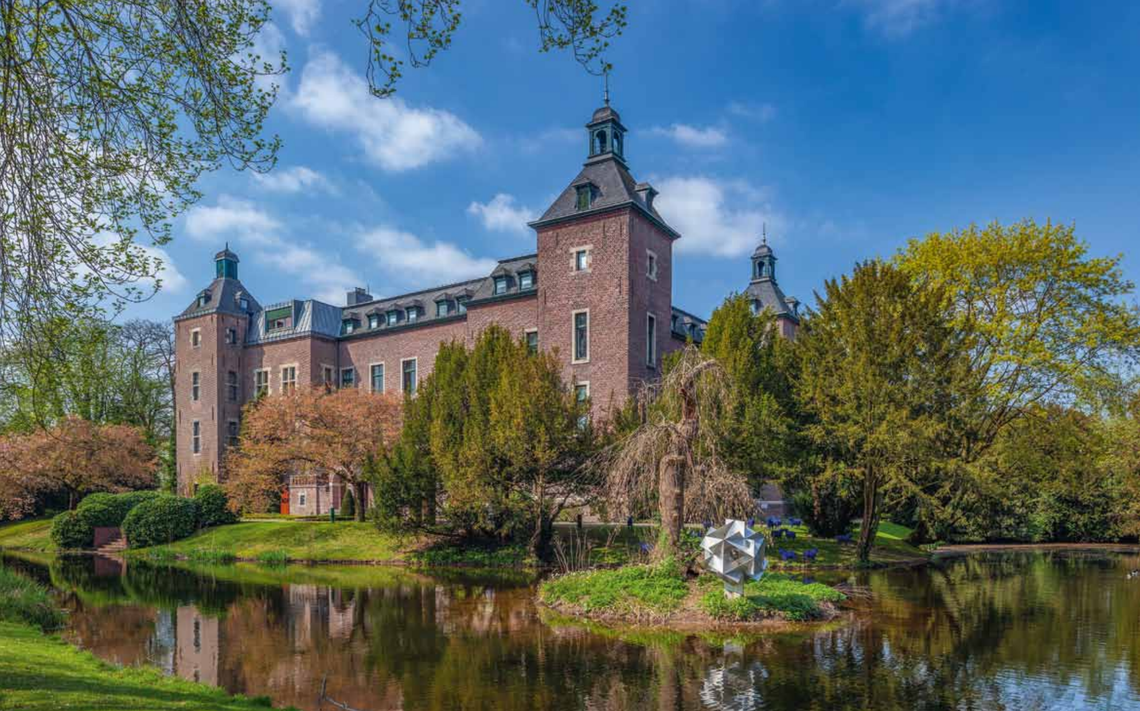
Schloss Neersen in Willich-Neersen