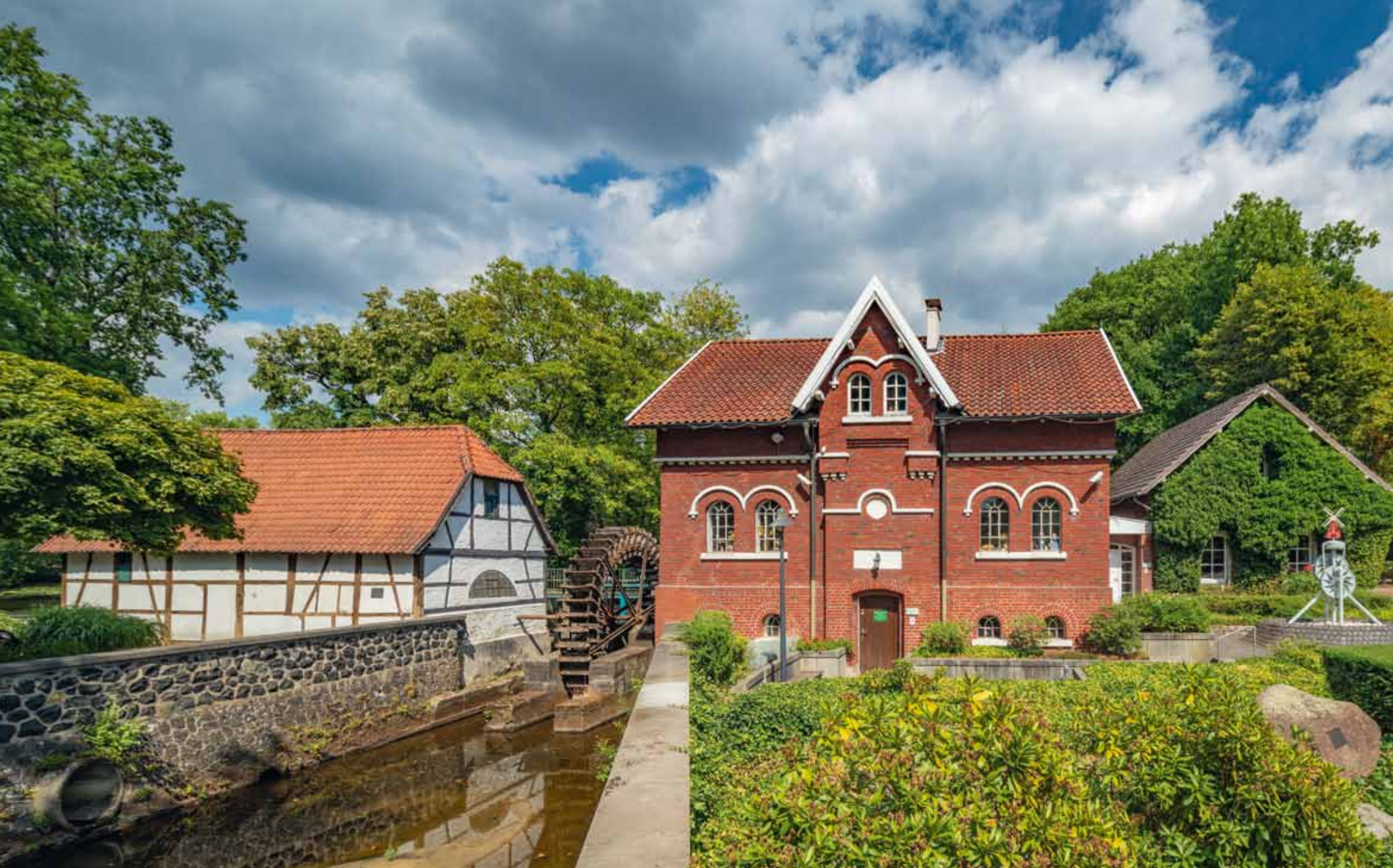
Ehemalige Wassermühle am Rotbach mit Mühlenmuseum in Dinslaken-Hiesfeld