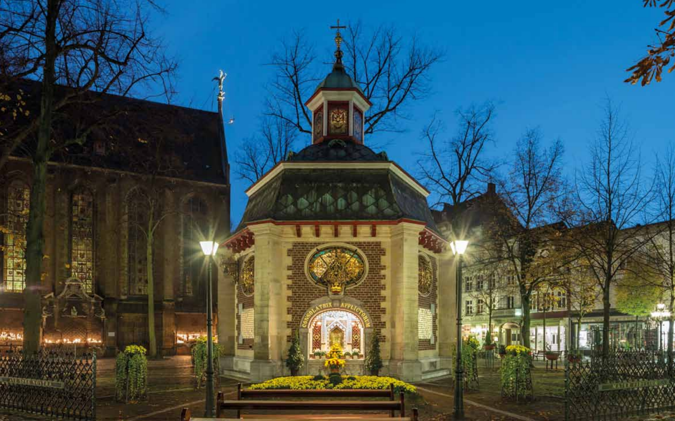
Gnadenkapelle in Kevelaer