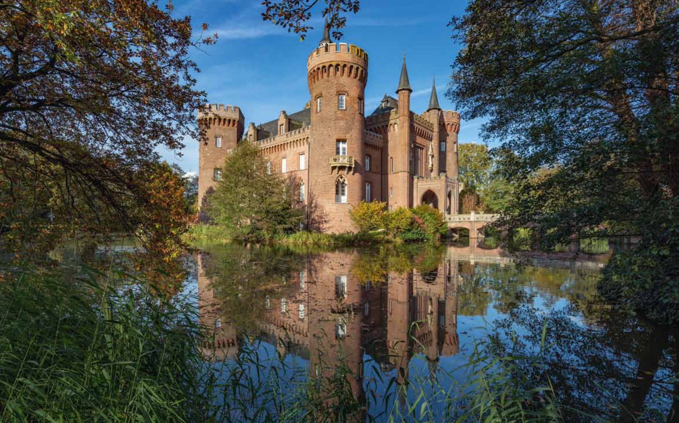
Schloss Moyland in Bedburg-Hau