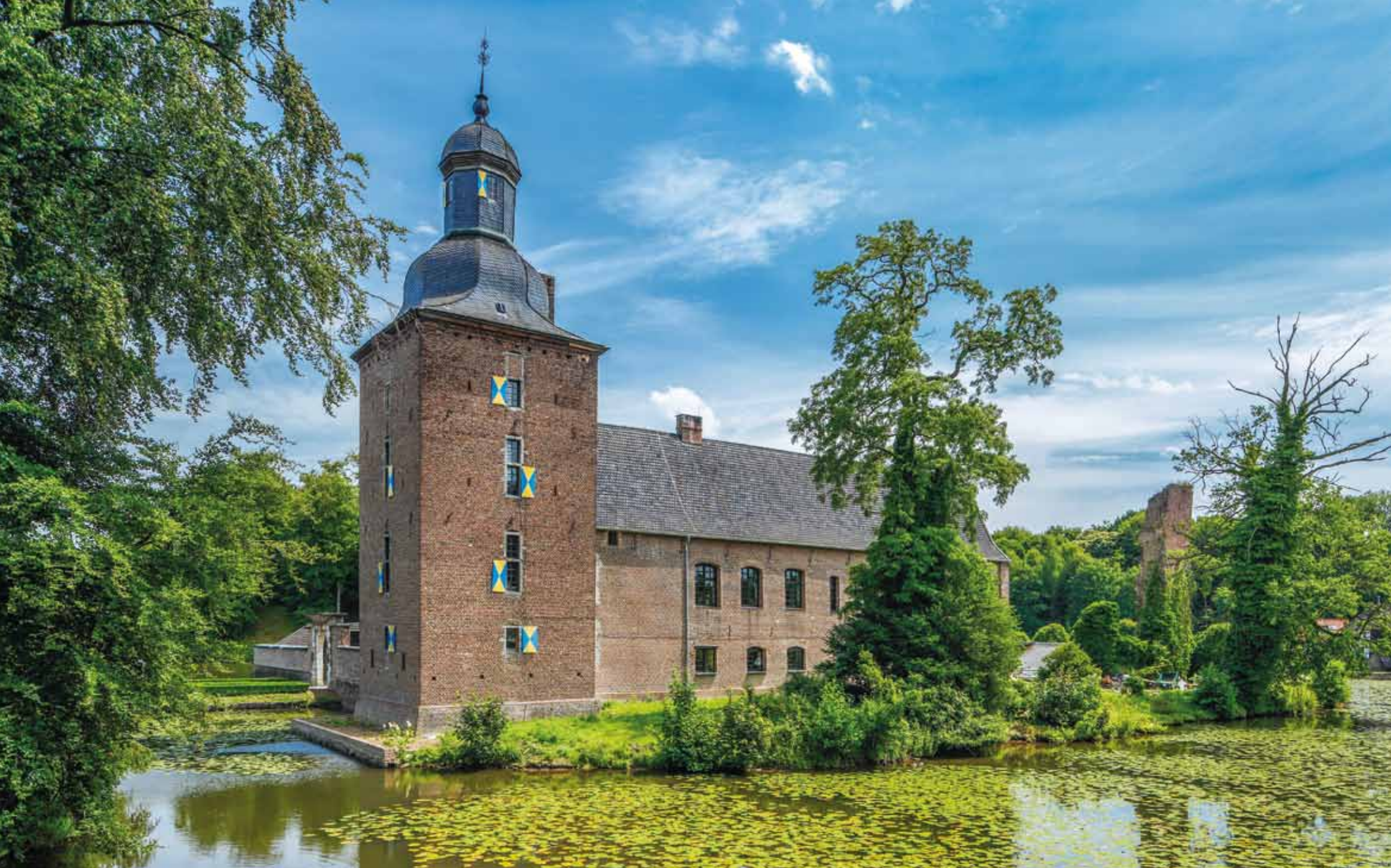
Schloss Tüschelbroich in Wegberg