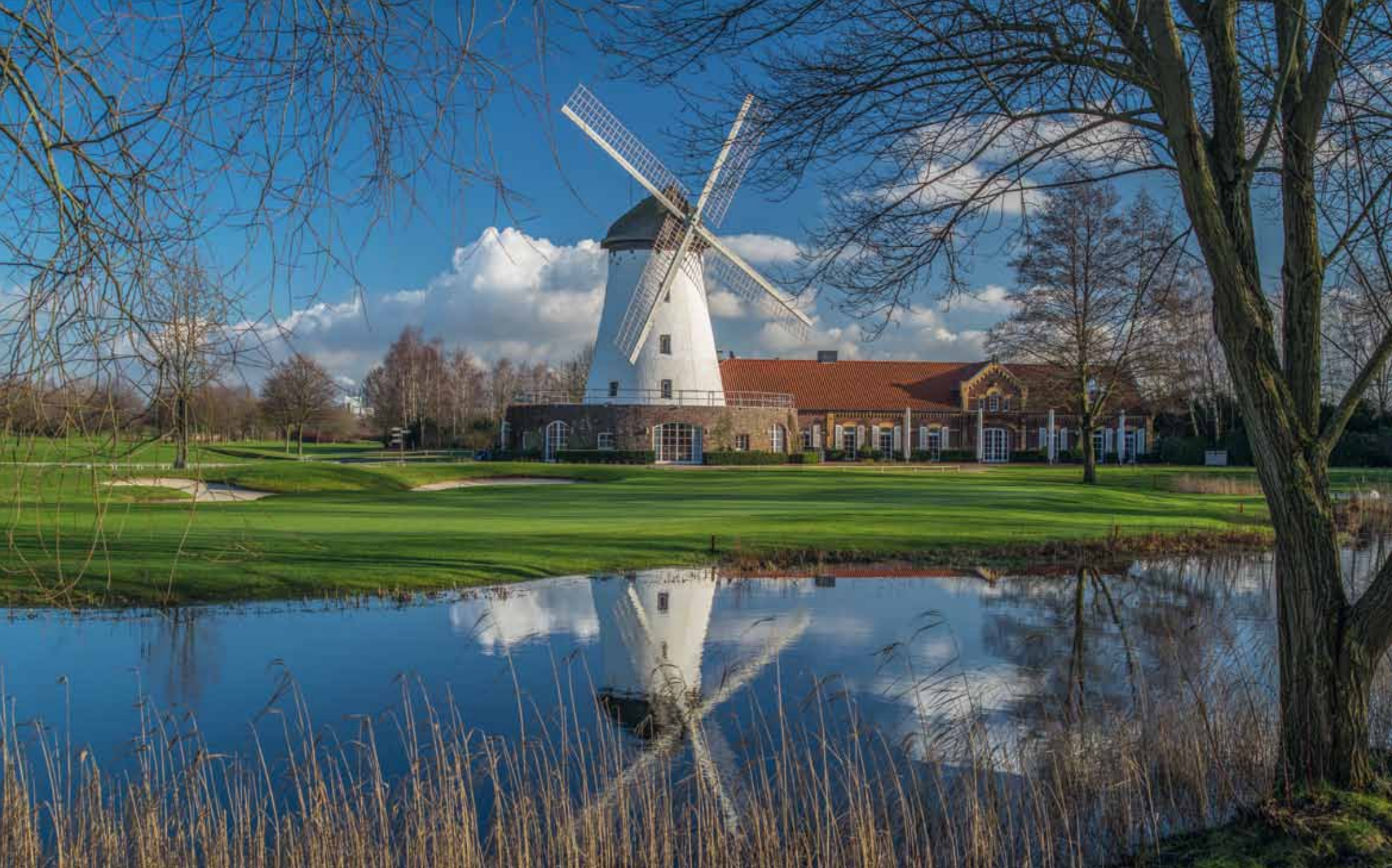
Elfrather Mühle, Clubhaus des Golf und Country Club e.V. in Krefeld-Traar