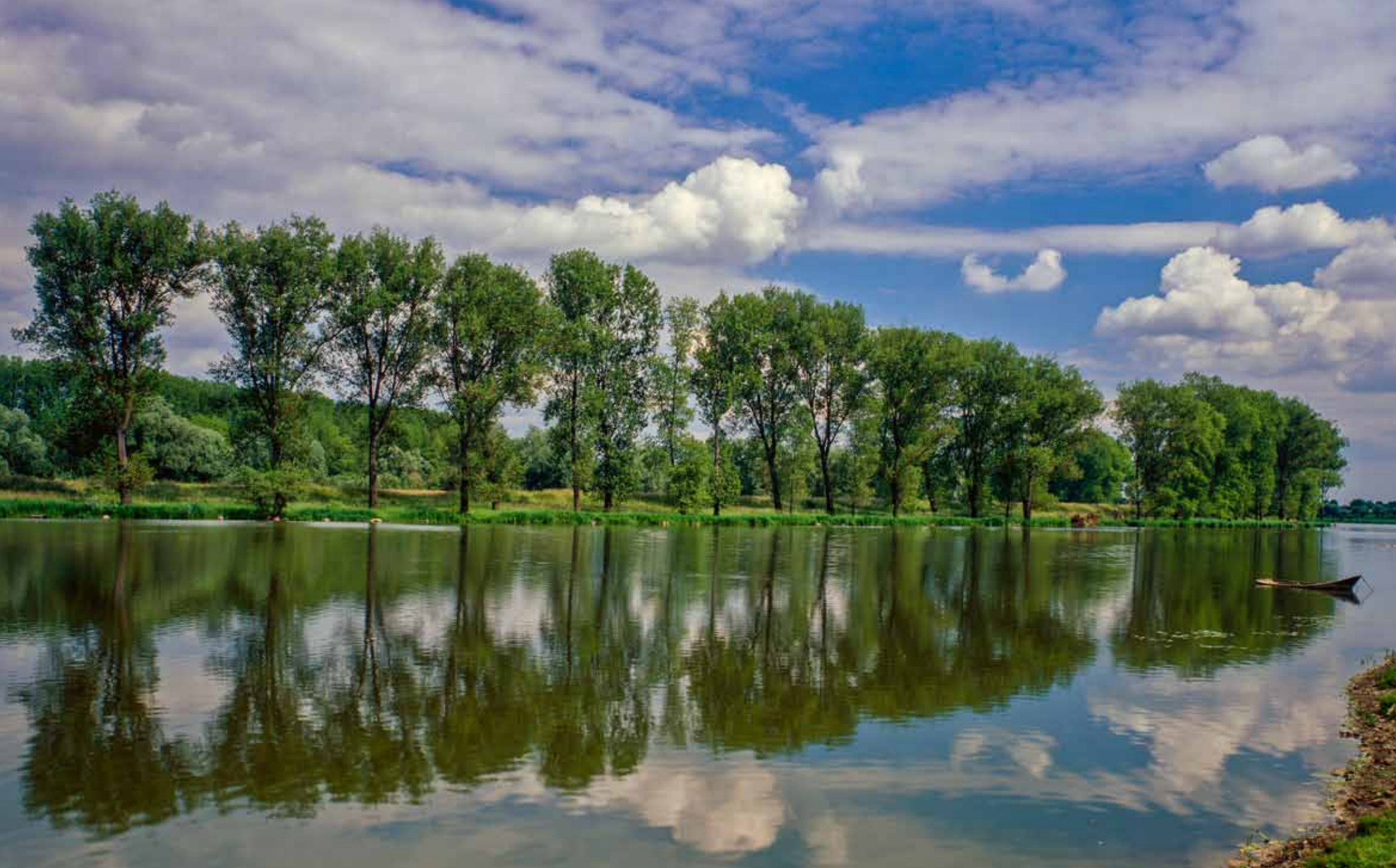
Altrhein an der Bilslicher Insel bei Xanten